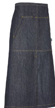
840 Dark Blue