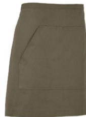
665 Dark Olive

Materiaal: 100% Organisch Fairtrade katoen Gewicht: Twill 210 g/m 2 (665, 990), Denim 10,5 oz (840)