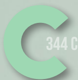
625 MINT GREEN