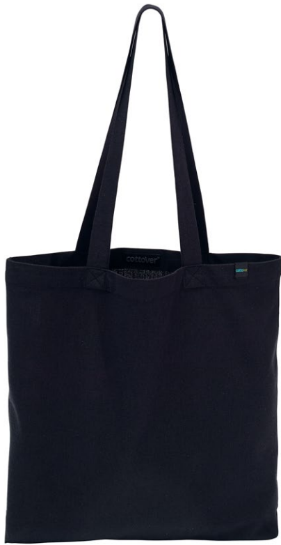
999 Graphite Melange