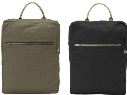
665 Dark Olive

Of het nu voor werk, school, boodschappen of reizen is, we hebben altijd een tas nodig. Van dagelijkse benodigdheden tot waardevolle items zoals een laptop of toiletartikelen, een praktische en betrouwbare tas is onmisbaar. Cottover biedt een compacte collectie essentiële tassen: eenvoudig, betaalbaar en ideaal voor grotere oplagen. Zelfs zonder branding straalt het Fairtrade-label een duidelijke boodschap van duurzaamheid en maatschappelijke verantwoordelijkheid uit.