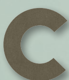
665 DARK OLIVE CANVAS