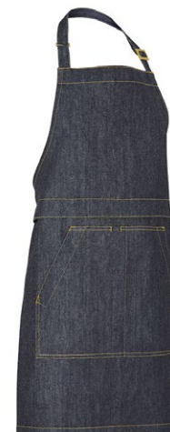
840 Dark Blue