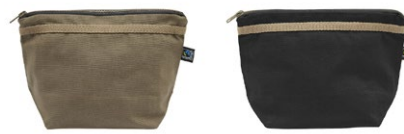
665 Dark Olive

Materiaal: 100% Organisch Fairtrade katoen Gewicht: 310 g/m 2