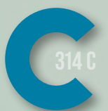
744 DARK TURQUOISE