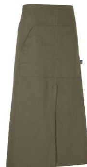
665 Dark Olive

Materiaal: 100% Organisch Fairtrade katoen Gewicht: Twill 210 g/m 2 (665, 990), Denim 10,5 oz (840)