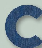
830 NAVY DENIM