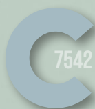
730 MISTY BLUE