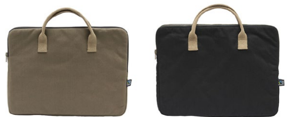
665 Dark Olive

Materiaal: 100% Organisch Fairtrade katoen Gewicht: 310 g/m 2