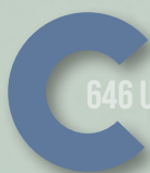
748 DUSTY BLUE