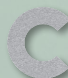
960 GREY MELANGE