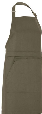
665 Dark Olive

Materiaal: 100% Organisch Fairtrade katoen Gewicht: Twill 210 g/m 2 (665, 990), Denim 10,5 oz (840)