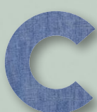
820 BLUE DENIM