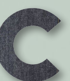
840 DARK BLUE DENIM