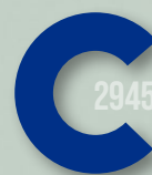
767 ROYAL BLUE