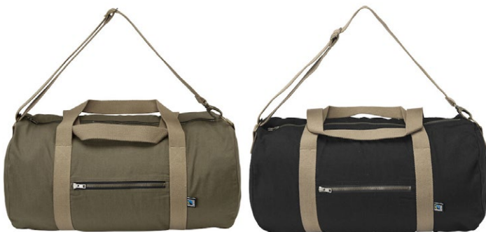
665 Dark Olive

Materiaal: 100% biologisch Fairtrade katoen Gewicht: 310 g/m 2