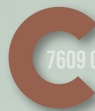
462 RUST RED