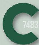
648 DARK GREEN