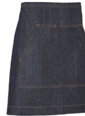
840 Dark Blue