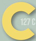
230 LIGHT YELLOW