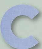
716 LIGHT BLUE OXFORD